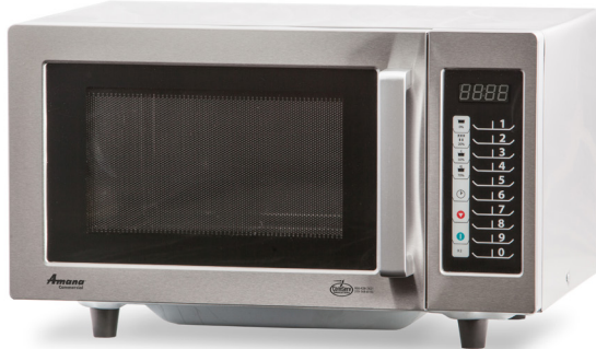
Se muestran modelos RMS10TS